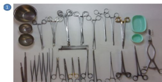
1 Regroupement des instruments par famille ou par temps opératoire sur table d'instrumentation : les parties utiles se regardent