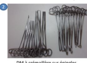
2 DM à crémaillère sur épingles