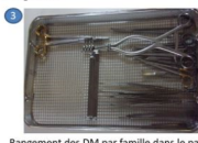
3 Rangement des DM par famille dans le panier : les parties utiles se regardent.